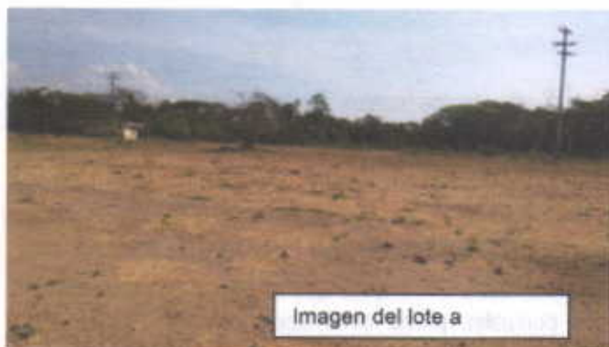
Imagen del lote a

El lote de terreno donde se proyecta construir los alojamientos para los soldados se localiza dentro de la base militar, es un área desprotegida de árboles y gramíneas, solamente se encuentran 4 árboles de especies varias entre los cuales destacamos, Brasil Haematoxylon brasileto , Guasimo Guazuma ulmifolia , Cacho de cabra, Acacia farnesiana , La edificación que se proyecta construir no afecta ambientalmente en nada el entorno, a pesar que no se conocen los diseños de la obra a construir y según lo percibido en campo, el sector norte oeste presenta una cobertura vegetal con árboles de Saman y otras especies forestales que sirve como zona de amortiguación y barreras rompe vientos. Se hace claridad en sentido que en la tabla aparecen relacionado el cacho de cabra como si fueran cuatro árboles solamente se trata de un solo árbol con cuatro rafimificaciones bajas, pero en realidad es un solo árbol.