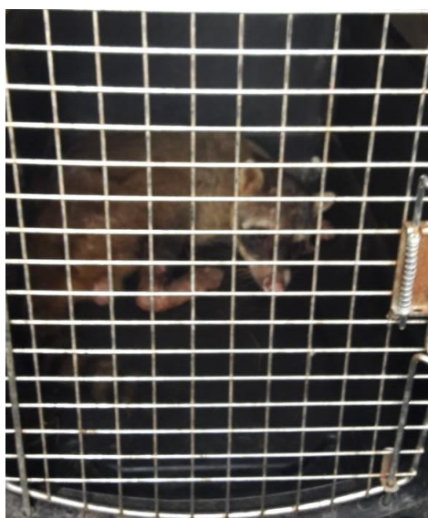
Imagen 2. Mapache recién ingresado