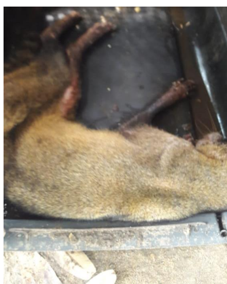
Imagen 3. Mapache muerto