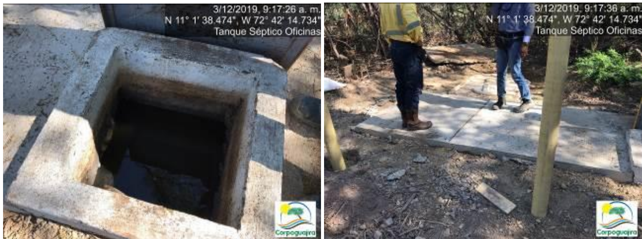
Fotografías No. 1 y 2. Estado de los Tanques Sépticos Oficinas. CARBONES DEL CERREJON LIMITED – CERREJON. COMPLEJO MINA. 03 de diciembre de 2019.

Correspondiente al estado de los Tanques Sépticos Oficina, se manifiesta que la empresa Carbones del Cerrejón Limited – Cerrejón, realizo la adecuación de unas trampas para el tratamiento de las aguas procedentes de las instalaciones denominadas (Administrativo Sur) en donde se realizan actividades de trabajo de oficina, del cual son resultantes los vertimientos que reciben dichos tanques sépticos. En el momento de la visita se evidencio que el tanque séptico estaba desbordando aguas residuales domesticas ARD en el suelo, esto ocasionado por el rebose de estas aguas debido a la falta de recolección de la misma, y no como asegura la empresa que se hace cada tres (3) días.