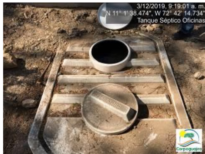
Fotografías No. 5 y 6. Rebose de aguas residuales domesticas ARD en los Tanques Sépticos Oficinas. CARBONES DEL CERREJON LIMITED – CERREJON. COMPLEJO MINA. 03 de diciembre de 2019.