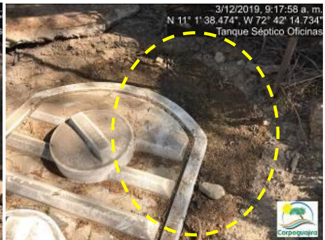
Fotografías No. 3 y 4. Rebose de aguas residuales domesticas ARD en los Tanques Sépticos Oficinas. CARBONES DEL CERREJON LIMITED – CERREJON. COMPLEJO MINA. 03 de diciembre de 2019. (Fuente: Corpoguajira 2019).