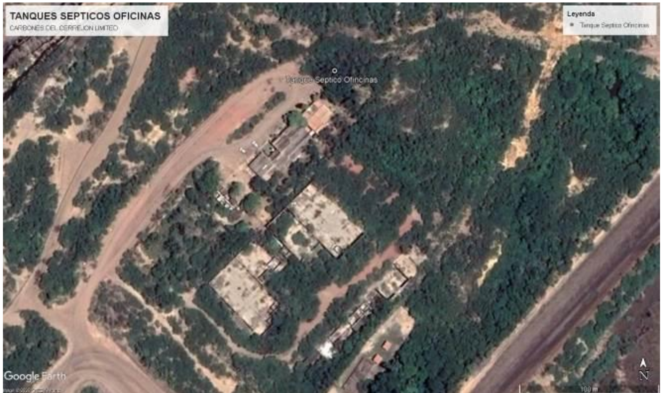
Imagen No. 1. Ubicación Geográfica de los Tanques Sépticos Oficinas. CARBONES DEL CERREJON LIMITED – CERREJON. COMPLEJO MINA. 03 de diciembre de 2019.