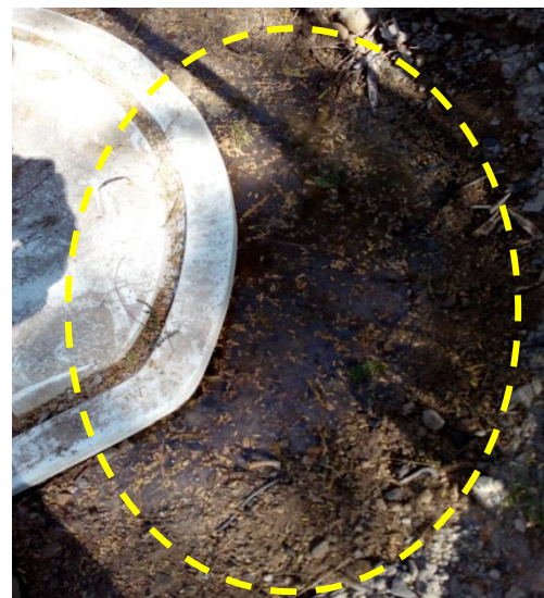
Fotografías No. 7 y 8. Recolección del agua y Rebose de aguas residuales domesticas ARD en los Tanques Sépticos Oficinas. CARBONES DEL CERREJON LIMITED – CERREJON. COMPLEJO MINA. 03 de diciembre de 2019.

En el momento de la visita de seguimiento, se evidencio que, en los Tanques Sépticos Oficinas, se produjo el vertimiento de aguas residuales domesticas provenientes del área de generación de las mismas, se consultó con el profesional