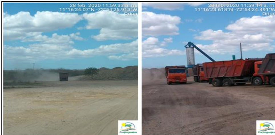
Figura 1. Emisiones de material particulado por tráfico de volquetas.

Se cuestionó por qué no existía riego de vías internas mientras se ejecutaban actividades, a lo que el administrador de la planta informó que el camión cisterna usado para riego de vías se encontraba en mantenimiento correctivo en Riohacha.