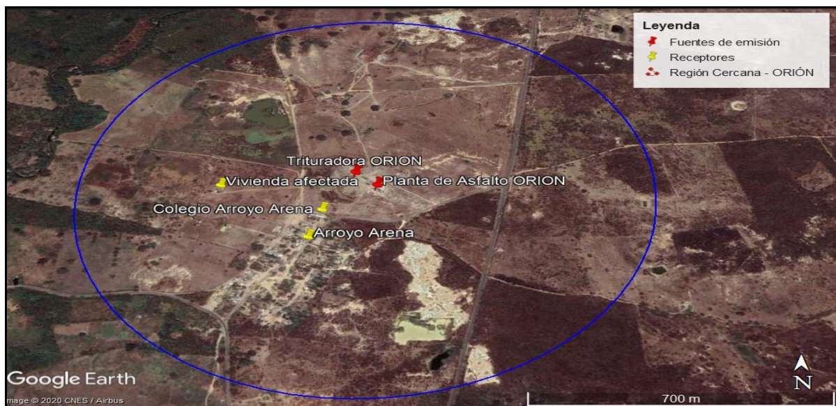
Figura 3. Región cercana de la empresa ORIÓN ASFALTOS & CONCRETOS S.A.S.

Tomando como referencia las Buenas Prácticas de Ingeniería establecidas en la Resolución 760 de 2010 emitida por el Ministerio de Ambiente, Vivienda y Desarrollo Territorial - MAVDT (hoy Ministerio de Ambiente y Desarrollo Sostenible - MADS), mediante la cual se adopta el Protocolo para el control y vigilancia de la contaminación atmosférica generada por fuentes fijas; se procedió a determinar la región cercana a la empresa ORIÓN ASFALTOS & CONCRETOS S.A.S., definida como la región que se obtiene al medir una distancia de 800 metros en todas las direcciones desde el borde de la estructura en la cual se encuentra la fuente de emisión. Se aclara que para este caso se tomó como referencia inicial, un punto ubicado entre la trituradora y la planta de asfalto. El resultado se puede observar en la Figura 3.