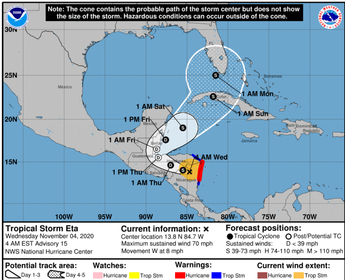
Figura 2: Posible trayectoria de la Tormenta Tropical ETA, para los próximos 5 días.