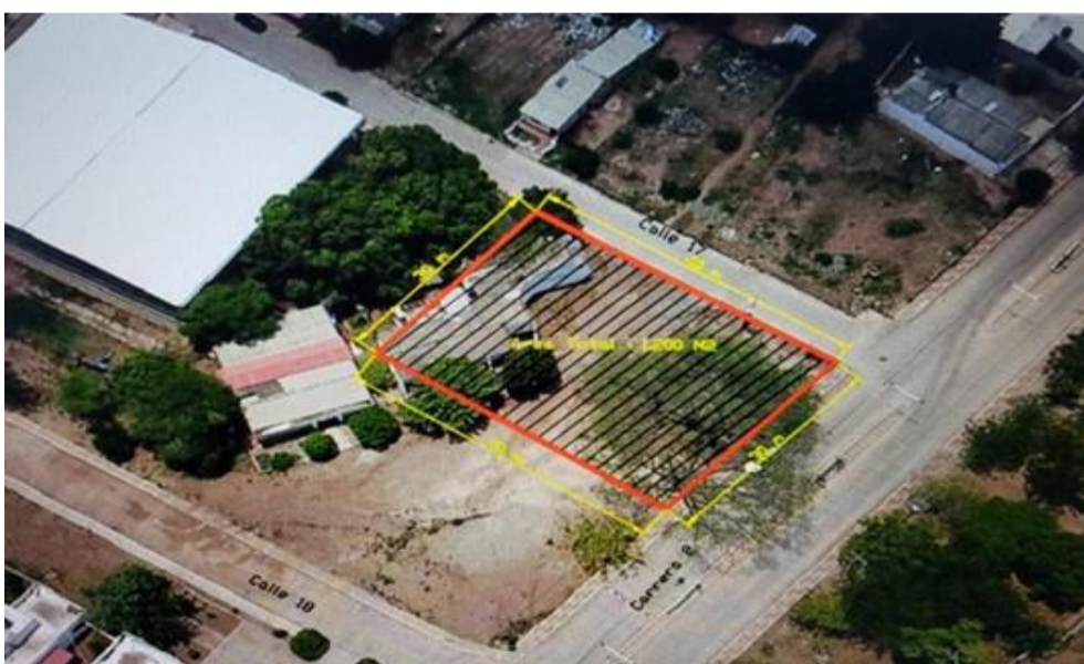
Fig. 2. Ubicación satelital zona de interés.