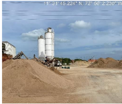
Foto 2. Vista al interior de la Planta de concreto 27/01/2021.