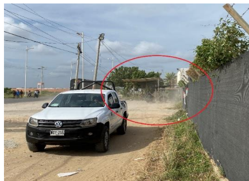
Foto 4. Evidencia de material particulado saliendo de la Planta de concreto 27/01/2021.