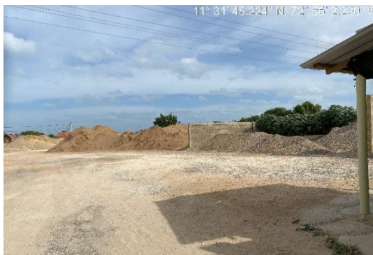
Foto 3. Evidencia del acopio de material de arrastre 27/01/2021