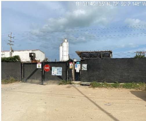
Foto 1. Entrada a la Planta de concreto 27/01/2021