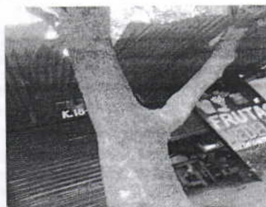
Vista del árbol de la especie Melicocca bijuga (Mamonsillo o Mamon) a intervenir (Tala)