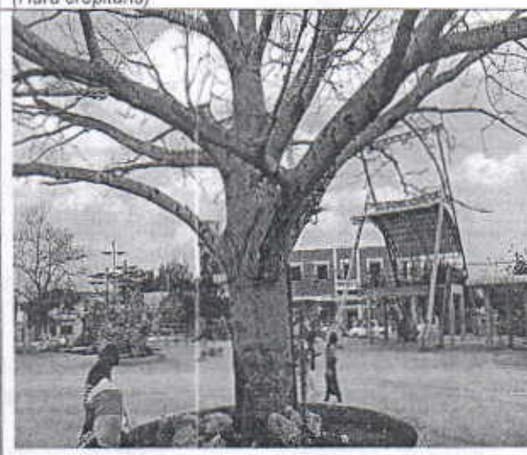
Especie forestal Ceiba blanca (Hura crepitans) totalmente seca