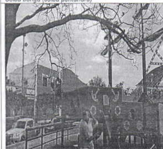
Ubicación e inclinación del árbol de la especie forestal Roble (Tabebuia rosea) en inmediaciones al parque infantil ubicado en la plaza central del municipio de Uribia