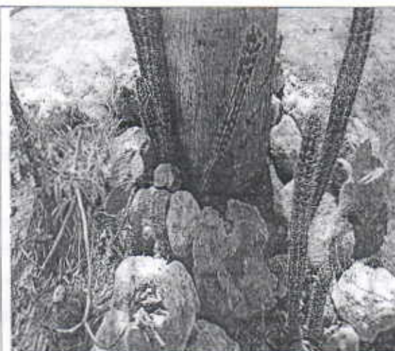
Residuos sólidos encontrados en una de las jardineras donde se encuentra el individuo de la especie forestal Ceiba bonga (ceiba pentandra)