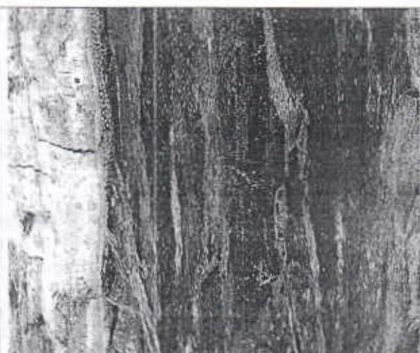
Corteza totalmente seca y afectada por la presencia del comején en individuo de la especie forestal Ceiba blanca (Hura crepitans)