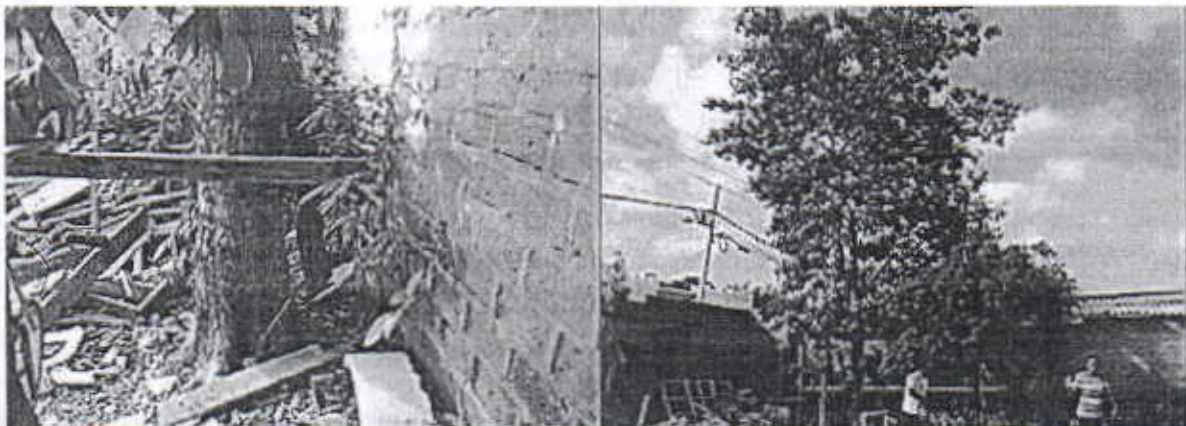
Árbol de Roble ( Tabebuia rosea ) en los límites del predio - Tamaño del árbol de Roble y ubicación en límite con el inmueble vecino.