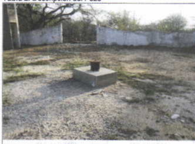
Tabla 2. Descripción del Pozo