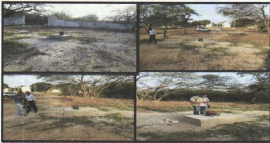
Fotografia No.5, 6, 7,8 Panorámica del ambiente que se observa alrededor del pozo