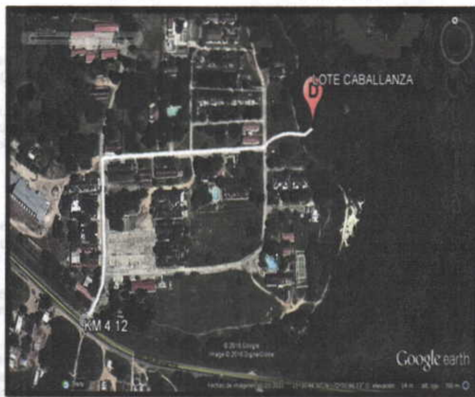
Figura No. 1 Localización Pozo.