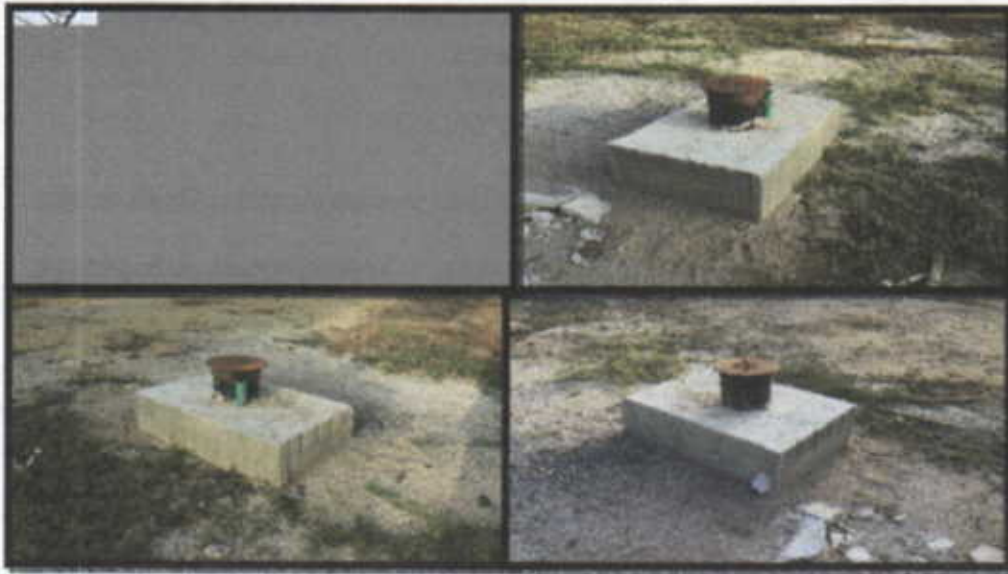
Fotografia No.1,2,3,4 Pozo de captación

COORDENADA: N 11°30'47.06" - E 72°51'41.71" Altura 13 m