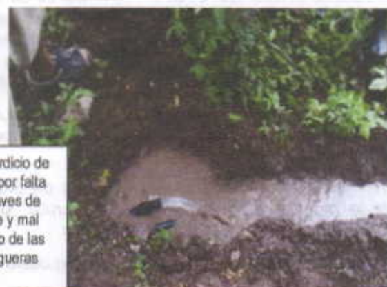
Desperdicio de agua por falta de llaves de cierre y mal estado de las mangueras