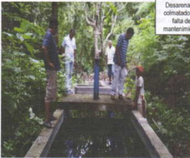
Desarenador colmatado por falta de mantenimiento