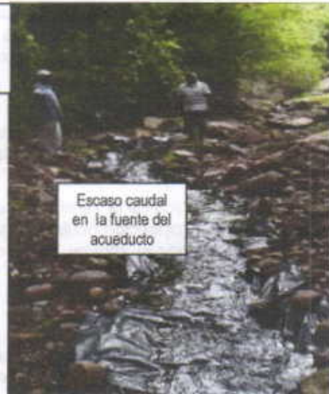
Escaso caudal en la fuente del acueducto