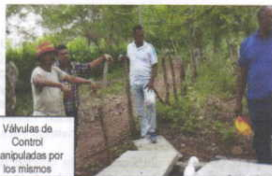
Válvulas de Control manipuladas por los mismos