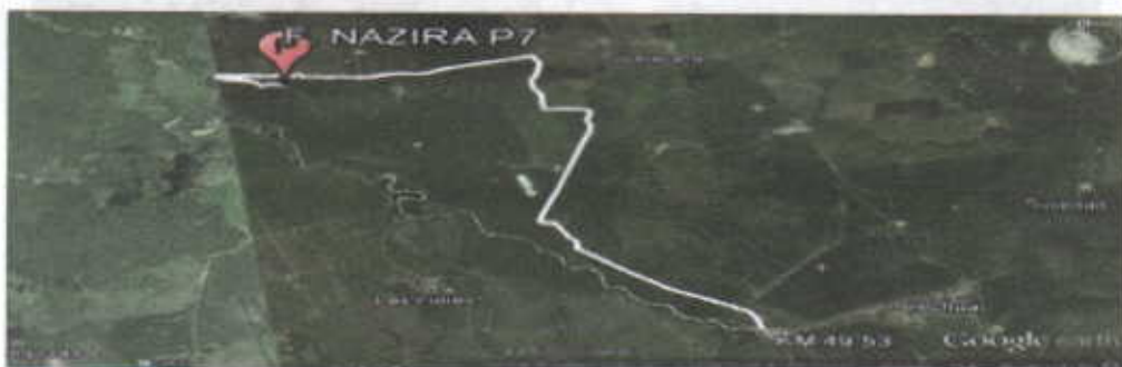
Figura No.1 Localización de la perforación en el Predio

El punto de perforación escogido se encuentra ubicado, en jurisdicción del corregimiento de Tigreras sector del caserío de Puente Bomba, en el municipio de Riohacha departamento de La Guajira, en el predio denominado Finca Nazira. Se llega al sitio por la vía que conduce del Municipio de Riohacha al Corregimiento de Mingueo, en plena carretera del troncal del Caribe, Cruzando a mano derecha en el kilómetro 49.53 (ver figura 1), a partir de ahí se recorren 8.36 Kilómetros en las coordenadas mostradas en la Tabla No. 1.