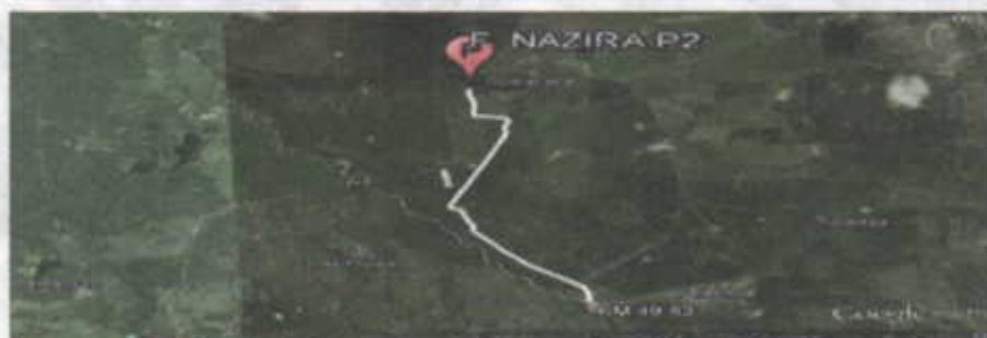
Figura No.1 Localización de la perforación en el Predio

El punto de perforación escogido se encuentra ubicado, en jurisdicción del corregimiento de Tigreras sector del caserío de Puente Bomba, en el municipio de Riohacha departamento de La Guajira, en el predio denominado Finca Nazira. Se llega al sitio por la vía que conduce del Municipio de Riohacha al Corregimiento de Mingueo, en plena carretera del troncal del caribe, Cruzando a mano derecha en el kilómetro 49.53 (ver figura 1), a partir de ahí se recorren 4.83 Kilómetros en las coordenadas mostradas en la Tabla No. 1.