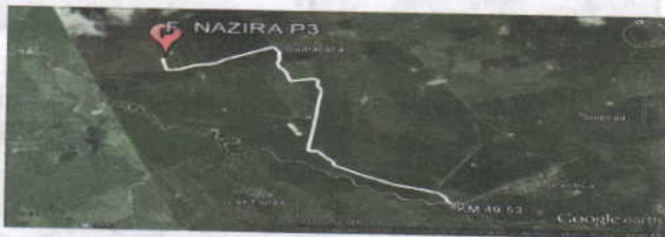
Figura No.1 Localización de la perforación en el Predio

El punto de perforación escogido se encuentra ubicado, en jurisdicción del corregimiento de Tigreras sector del caserio de Puente Bomba, en el municipio de Riohacha - departamento de La Guajira, en el predio denominado Finca Nazira. Se llega al sitio por la vía que conduce del Municipio de Riohacha al Corregimiento de Mingueo, en plena carretera del troncal del Caribe, cruzando a mano derecha en el kilómetro 49.53 (ver figura 1), a partir de ahí se recorren 7.01 Kilómetros en las coordenadas mostradas en la Tabla No. 1.