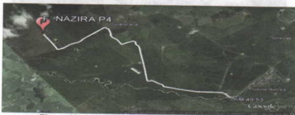
Figura No.1 Localización de la perforación en el Predio

El punto de perforación escogido se encuentra ubicado, en jurisdicción del corregimiento de Tigreras sector del caserio de Puente Bomba, en el municipio de Riohacha departamento de La Guajira, en el predio denominado Finca Nazira. Se llega al sitio por la vía que conduce del Municipio de Riohacha al Corregimiento de Mingueo, en plena carretera del troncal del Caribe, Cruzando a mano derecha en el kilómetro 49.53 (ver figura 1), a partir de ahí se recorren 7.45 Kilómetros, exactamente ubicado en las coordenadas mostradas en la Tabla No. 1.