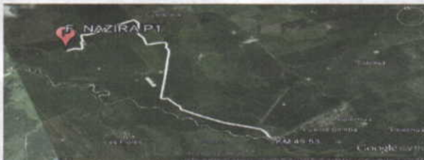
Figura No.1 Localización de la perforación en el Predio

El punto de perforación escogido se encuentra ubicado, en jurisdicción del corregimiento de Tigreras sector del caserio de Puente Bomba, en el municipio de Riohacha departamento de La Guajira, en el predio denominado Finca Nazira. Se llega al sitio por la vía que conduce del Municipio de Riohacha al Corregimiento de Mingueo, en plena carretera del troncal del caribe, Cruzando a mano derecha en el kilómetro 49.53 (ver figura 1), a partir de ahí se recorren 7 Kilómetros en las coordenadas mostradas en la Tabla No. 1.