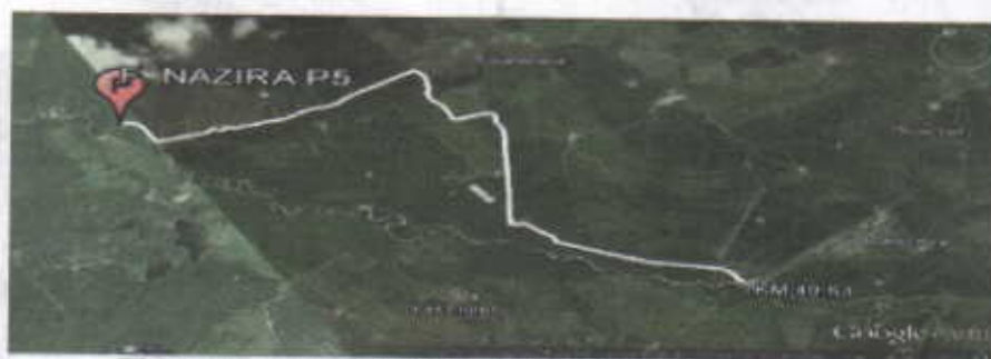
Figura No.1 Localización de la perforación en el Predio

El punto de perforación escogido se encuentra ubicado, en jurisdicción del corregimiento de Tigreras sector del caserío de Puente Bomba, en el municipio de Riohacha departamento de La Guajira, en el predio denominado Finca Nazira. Se llega al sitio por la vía que conduce del Municipio de Riohacha al Corregimiento de Mingueo, en plena carretera del troncal del Caribe, Cruzando a mano derecha en el kilómetro 49.53 (ver figura 1), a partir de ahí se recorren 8.22 Kilómetros en las coordenadas mostradas en la Tabla No. 1.