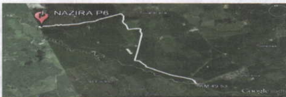
Figura No.1 Localización de la perforación en el Predio

El punto de perforación escogido se encuentra ubicado, en jurisdicción del corregimiento de Tigreras sector del caserío de Puente Bomba, en el municipio de Riohacha departamento de La Guajira, en el predio denominado Finca Nazira. Se llega al sitio por la vía que conduce del Municipio de Riohacha al Corregimiento de Mingueo, en plena carretera del troncal del Caribe, Cruzando a mano derecha en el kilómetro 49.53 (ver figura 1), a partir de ahí se recorren 7.87 Kilómetros en las coordenadas mostradas en la Tabla No. 1.