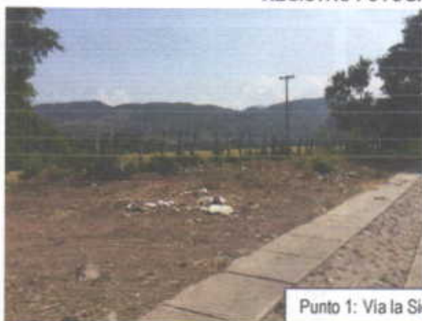
Punto 1: Vía la Sierra - Cercanía al Río