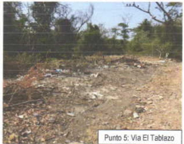
Punto 5: Via El Tablazo