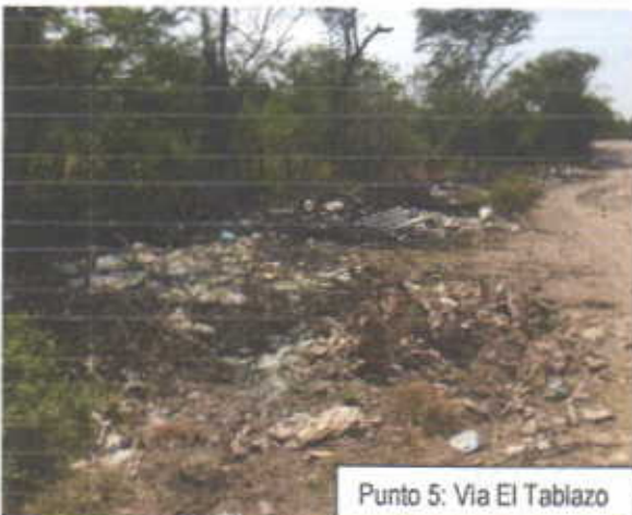
Punto 5: Via El Tablazo