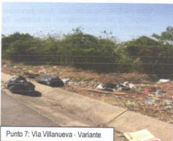
Punto 7: Via Villanueva - Variante