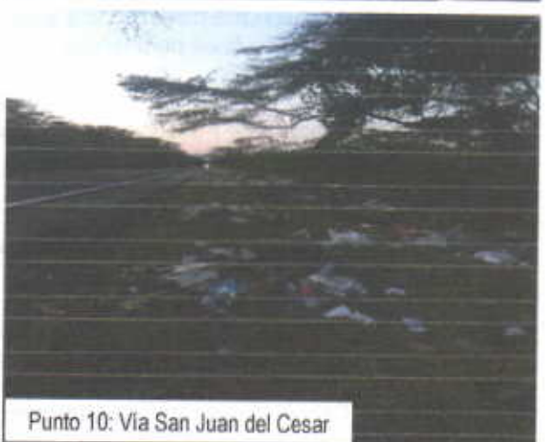
Punto 10: Via San Juan del Cesar