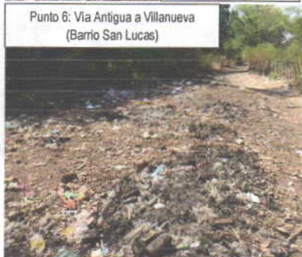
Punto 6: Via Antigua a Villanueva (Barrio San Lucas)