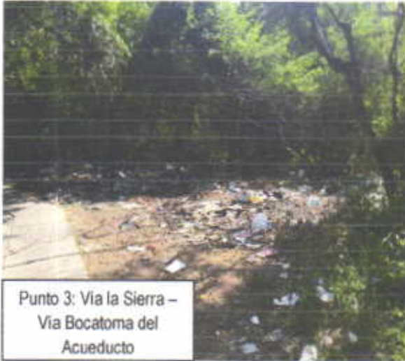
Punto 3: Via la Sierra – Via Bocatoma del Acueducto