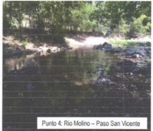
Punto 4: Rio Molino – Paso San Vicente