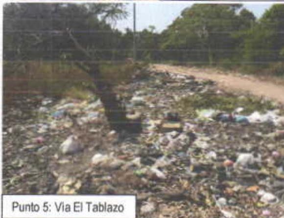
Punto 5: Via El Tablazo