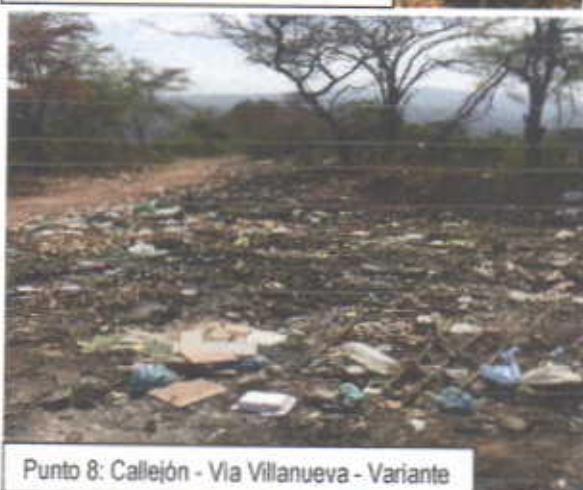
Punto 8: Callejón - Via Villanueva - Variante