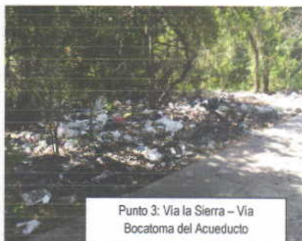
Punto 3: Vía la Sierra - Vía Bocatoma del Acueducto