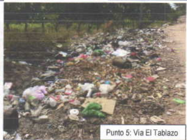
Punto 5: Via El Tablazo