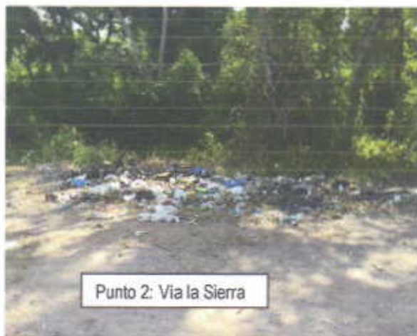
Punto 2: Vía la Sierra