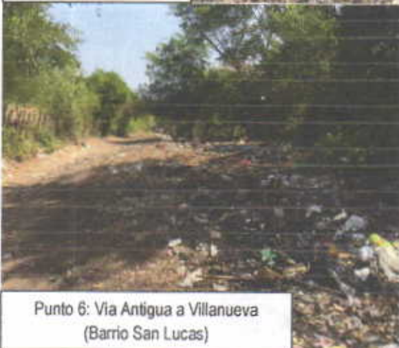
Punto 6: Via Antigua a Villanueva (Barrio San Lucas)