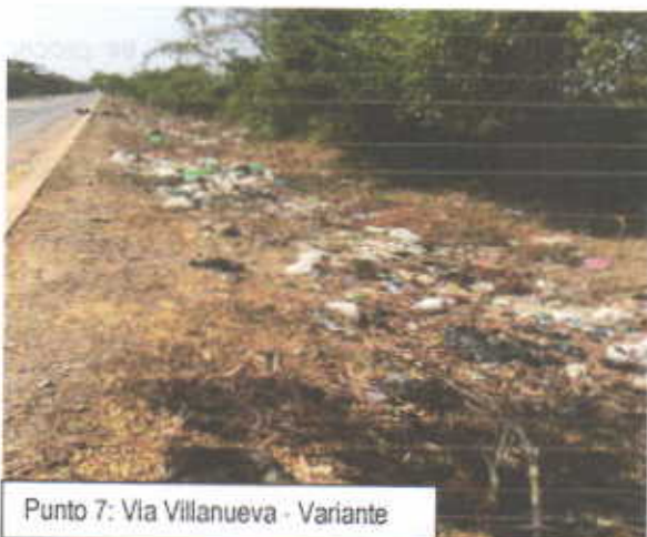
Punto 7: Via Villanueva - Variante