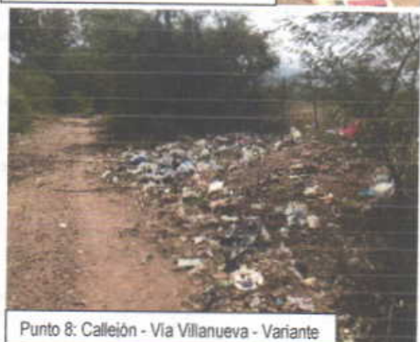
Punto 8: Callejón - Via Villanueva - Variante