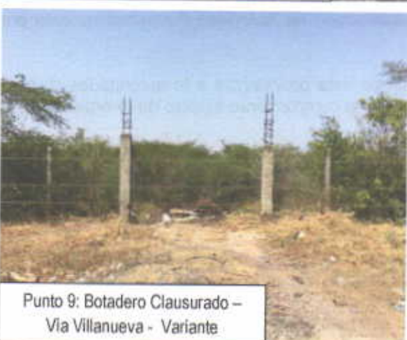
Punto 9: Botadero Clausurado – Via Villanueva - Variante