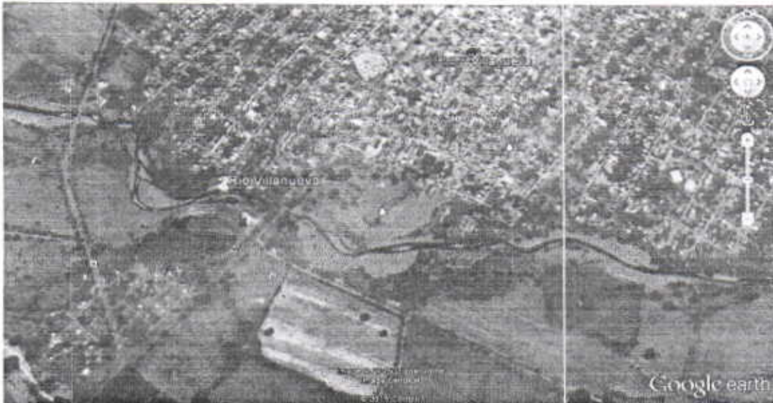
IMAGEN SATELITAL DEL AREA A EVALUAR