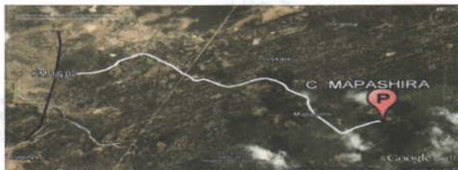
Figura No.1 Localización de la perforación en el Predio