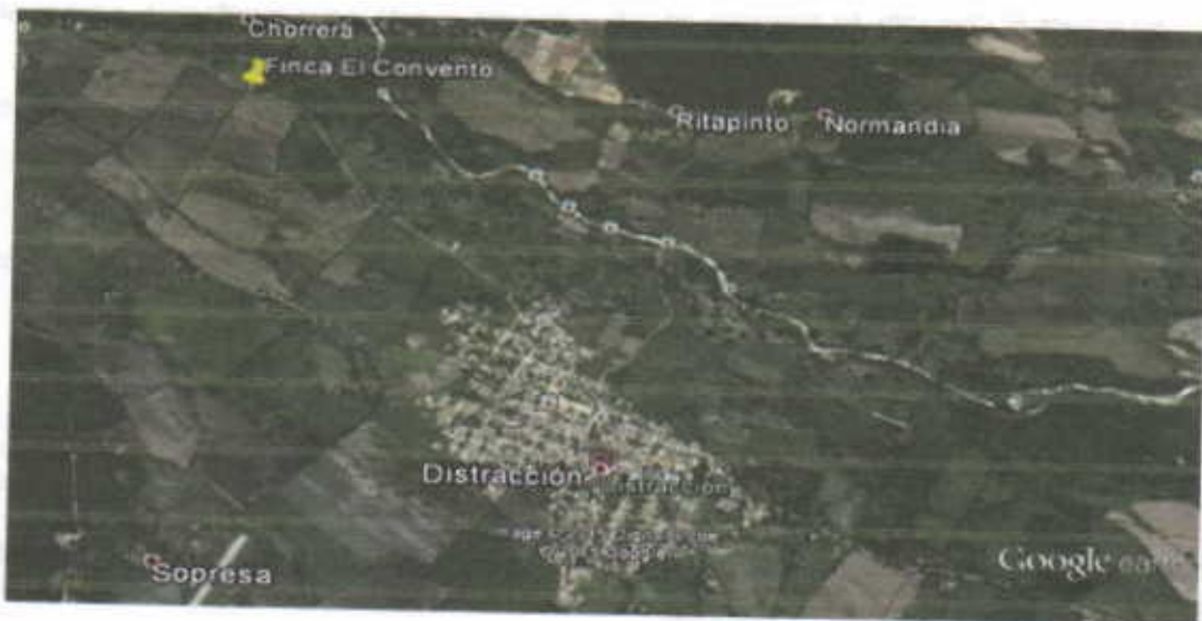
IMAGEN SATELITAL DEL AREA