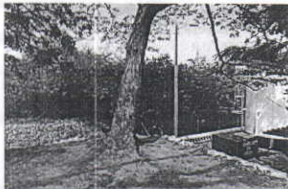
Ambos requieren podas