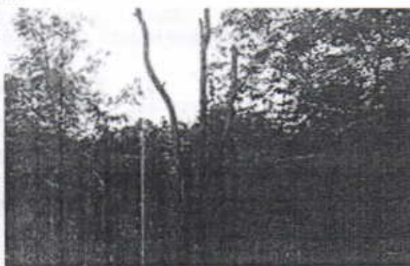
Seco (Dejarse en el sitio)