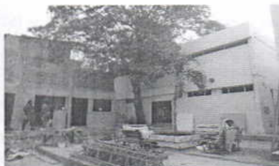
Árbol de Roble pegado a la infraestructura y su copa se observa por encima del tejado