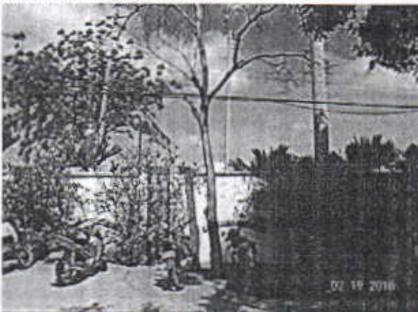
Árbol de Roble ubicado en la parte interna