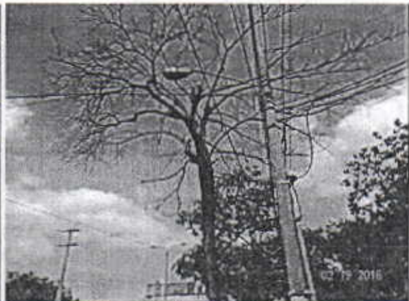
Árbol de Roble ubicado en la parte externa