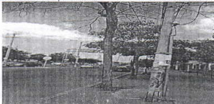
Roble seco ubicado en la parte externa de la Policía Nacional