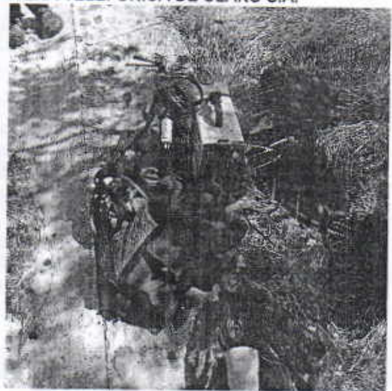
Herramientas de Trabajo