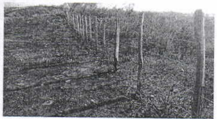
Finca Monte rey