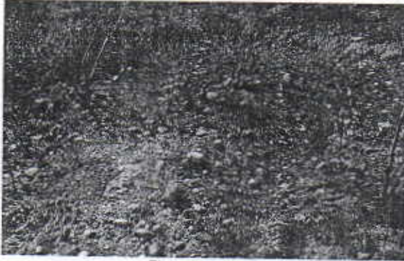
Finca Puede Ser