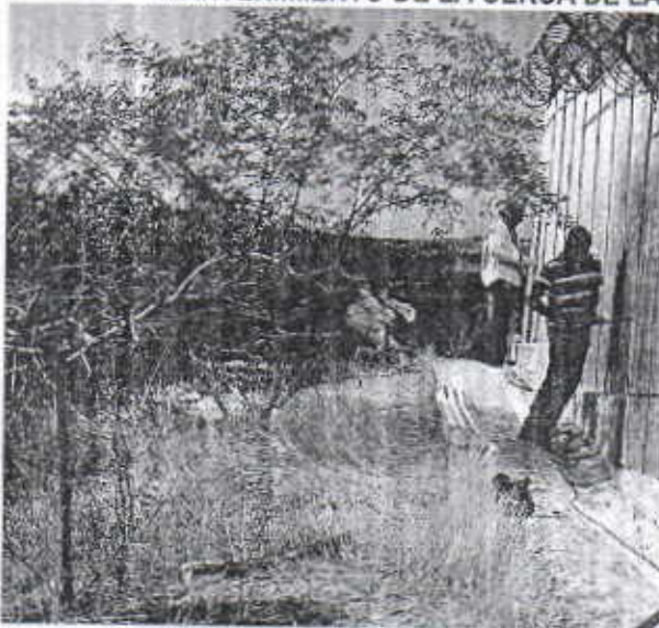
Personal de Mantenimiento