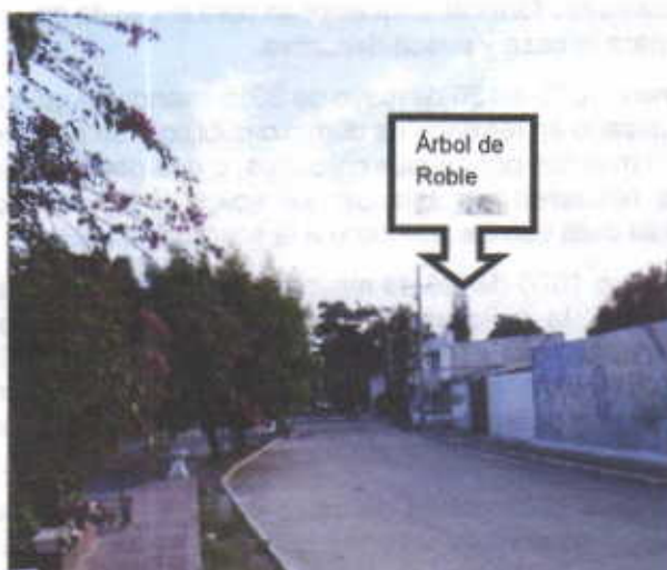
Árbol de Roble

Con la poda, se facilitaría la organización e instalación de las redes eléctricas requeridas para el buen funcionamiento de las oficinas de la Alcaldía Municipal.