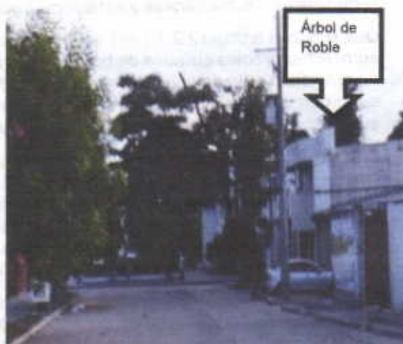
Árbol de Roble