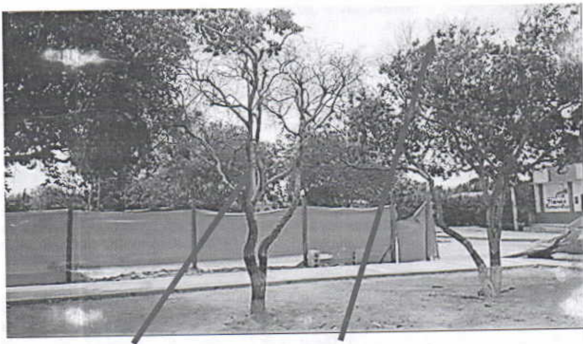
Muerte descendente de la especie Oiti ( Licania tomentosa ) en el parque de Carraipia