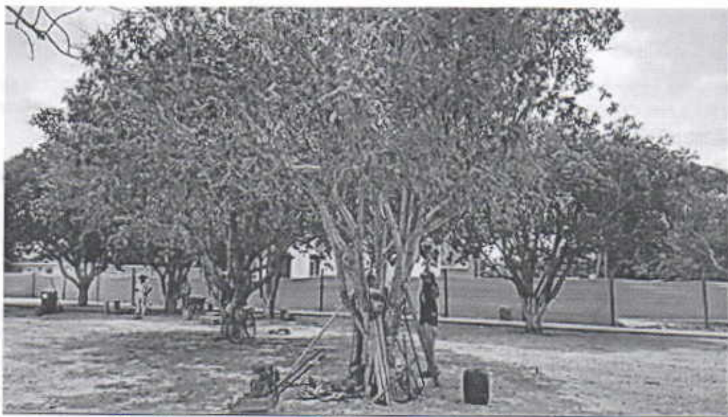
Otros árboles de la especie Oiti ( Licania tomentosa ) dentro del parque