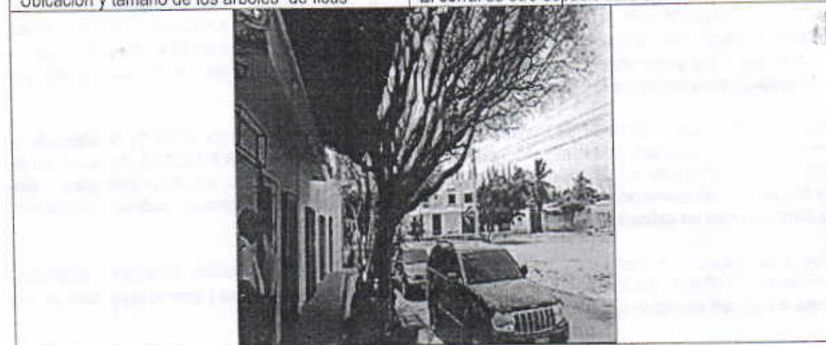
Demostración de los árboles de Laurel (ficus sp), sin follaje