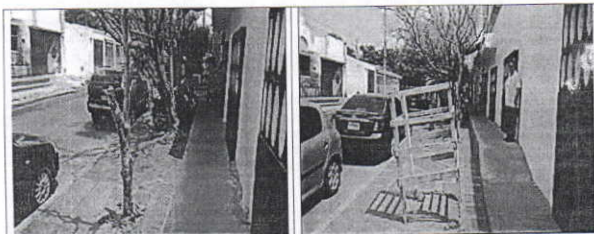
Ubicación y tamaño de los árboles de ficus