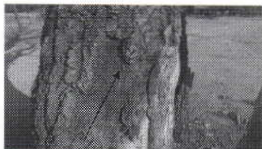
Fuste seco con presencia de daños mecánicos