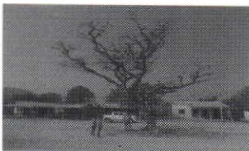
Árbol de corazón fino seco vista general