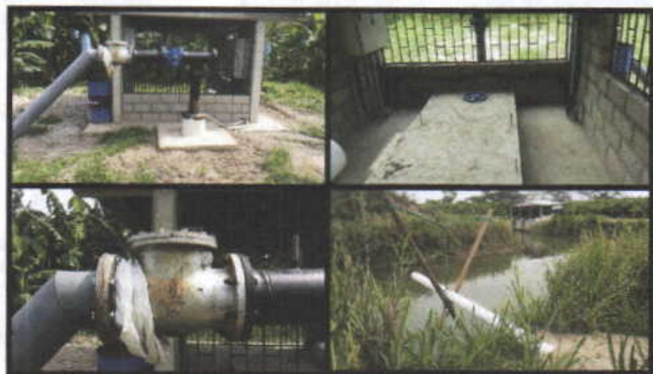
Fotografía No.5, 6, 7, 8 Caseta y Reservorio.