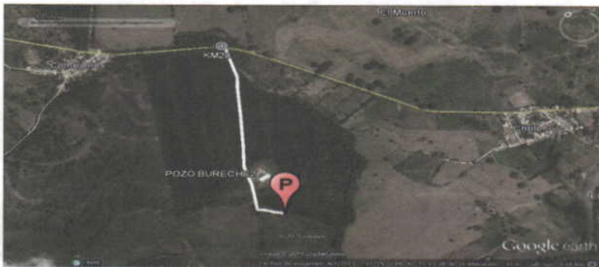
Figura No. 1 Localización Predio FINCA BURECHE.BANAORGANICO S.A.S

El pozo de aprovechamiento se encuentra ubicado, en jurisdicción del Municipio de Riohacha departamento de La Guajira, en el predio denominado FINCA BURECHE. Se llega al sitio por la vía que conduce de la ciudad de Riohacha a Santa Marta, cruzando a mano izquierda en el kilómetro 56.31, por la vía secundaria que comunica las poblaciones de Ebanal, Tigrera los Comejenes, Chole, una vez en esta vía se cruza a mano derecha en el kilómetros 20y realizando un recorrido de 1kilómetro hacia dentro se encuentra el pozo(ver figura 1), en las coordenadas mostradas en el Tabla No.1.