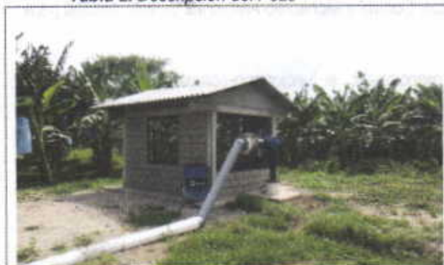
Tabla 2. Descripción del Pozo

Diámetro: 14 pulgadas Profundidad: 144 metros Tiempo en operación: 12 horas diarias Revestimiento: Tubería PVC Roscado de 0.40 Método de extracción: Bomba Sumergible Caseta: posee caseta adecuada Periodo de captación (Horas / días): 12 Periodo de captación (No. días / mes): 20 Periodo de captación (No. Mes / año): 11 Observaciones: en buenas condiciones.