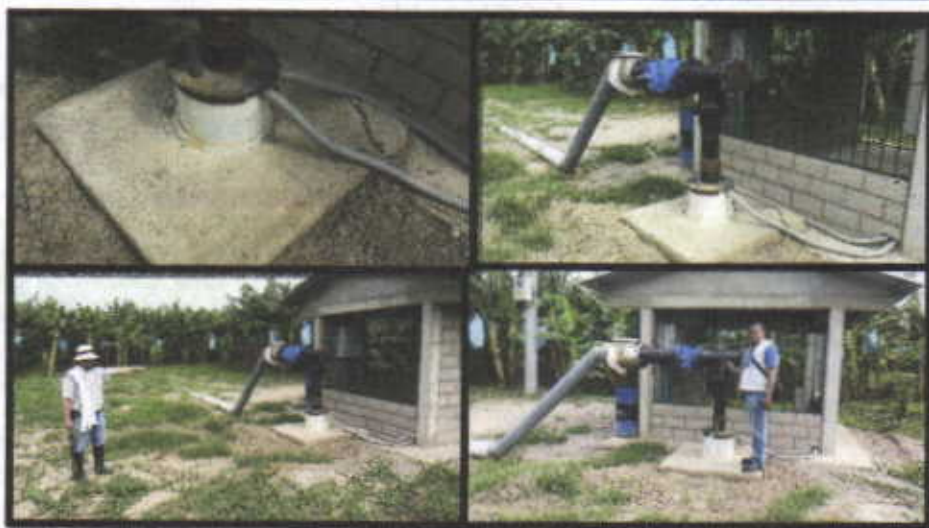
Fotografía No.1,2,3,4 Pozo de captación