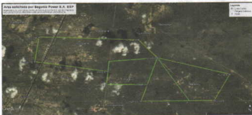
Mapa 1. Área solicitada por la empresa Begonia S.A.S

Que el día 28 de Enero de 2016, se practicó visita de inspección ocular a las comunidades indígenas de WALUWAMPANA, TALAURA, KALALOW Y PARAISO , ubicadas en el área rural del municipio de Uribia, con el fin de atender la solicitud de la empresa BEGONIA POWER S.A.S E.S.P. , en donde se pudo comprobar los aspectos técnicos de la SOLICITUD PERMISO DE RECOLECCIÓN CON FINES DE ELABORACION DE ESTUDIOS AMBIENTALES.