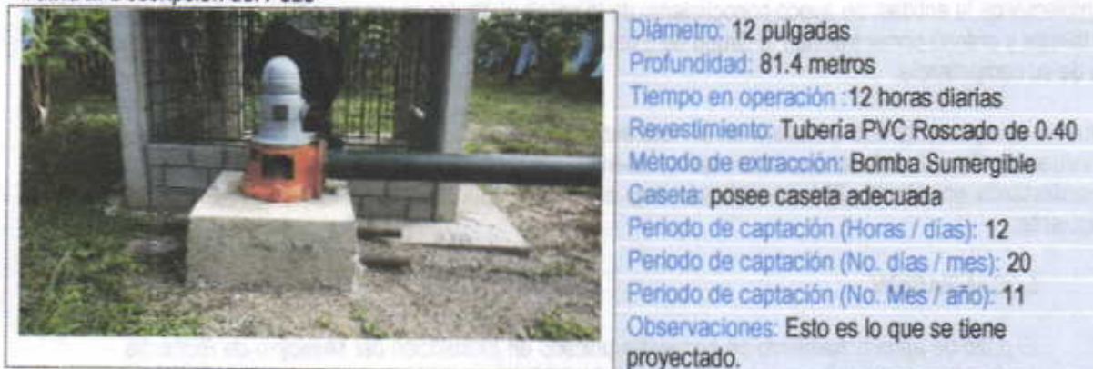
Tabla 2. Descripción del Pozo