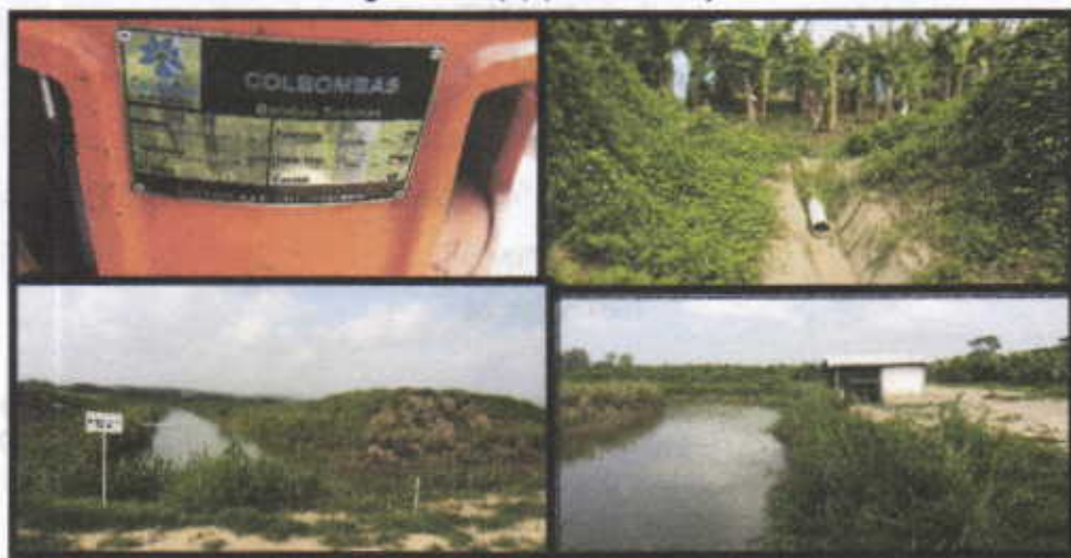
Fotografía No.5, 6, 7, 8 Capacidad de la Bomba y Reservorio.