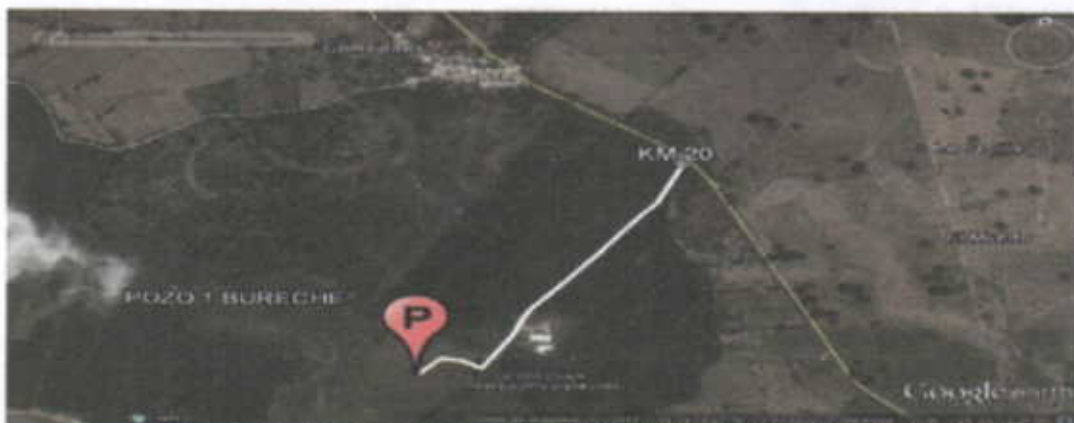
Figura No. 1 Localización Predio FINCA BURECHE.BANAORGANICO S.A.S

El pozo de aprovechamiento se encuentra ubicado en jurisdicción del Municipio de Riohacha - La Guajira en el predio denominado FINCA BURECHE, se llega al sitio por la vía que conduce de la ciudad de Riohacha a Santa Marta, cruzando a mano izquierda en el kilómetro 56.31, por la vía secundaria que comunica las poblaciones de Ebanal, Tigrera los Comejenes, Chole, una vez en esta vía se cruza a mano derecha en el kilómetros 20 y realizando un recorrido de 1,1kilómetros hacia dentro se encuentra el pozo(ver figura 1), en las coordenadas mostradas en el Tabla No.1.