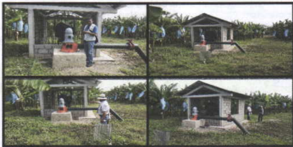
Fotografía No.1,2,3,4 Pozo de captación