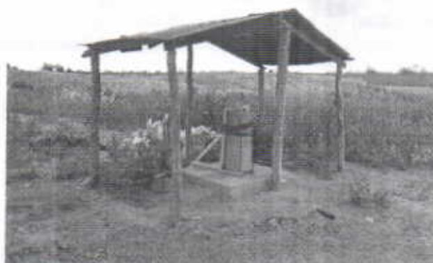
Tabla 2. Descripción del Pozo

Diámetro: 6 pulgadas Profundidad: 150 metros Tiempo en operación: 12 horas diarias Revestimiento: Tubo acampanado RD 21 PVC Método de extracción: Bomba Sumergible Caseta: posee caseta que no cumple con requisitos técnicos Periodo de captación (Horas / días): 12 Periodo de captación (No. días / mes): 20 Periodo de captación (No. Mes / año): 11 Observaciones: Esto es lo que se tiene proyectado.