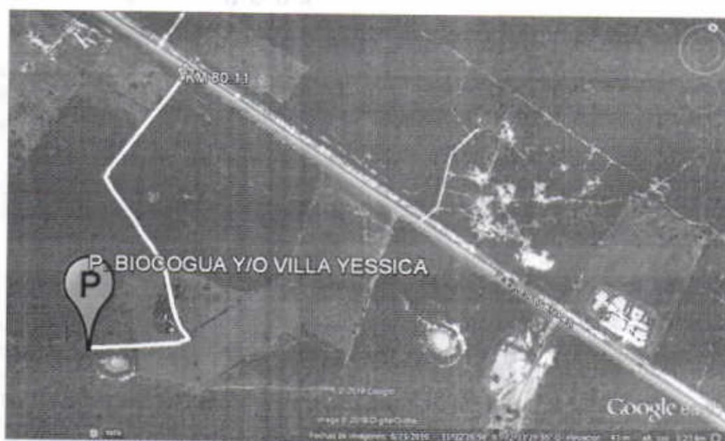
Figura No. 1 Localización Predio FINCA BIOCOGUA Y/O VILLA YESSICA.