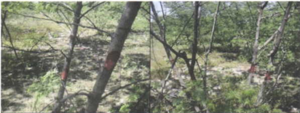
Ubicación de parcelas y marcaje de la regeneración natural en estado Latizal