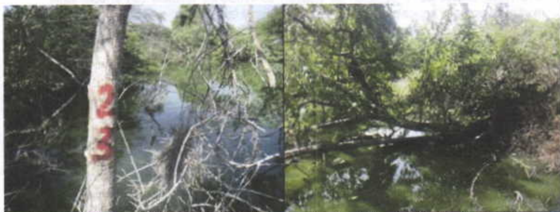
Marcaje de individuos arbóreos en borde de la laguna y árbol caído hacia el interior del cuerpo de agua