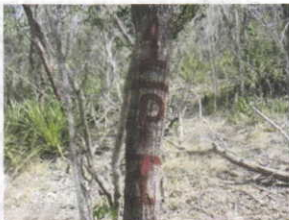
Parcela No 1. Del área a intervenir