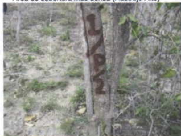
Parcela No. 2