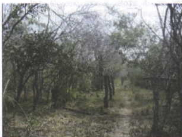
Area de cobertura mas densa (Rastrojo Alto)