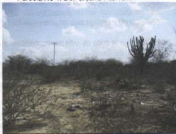
Area de cobertura a intervenir (Rastrojo bajo)