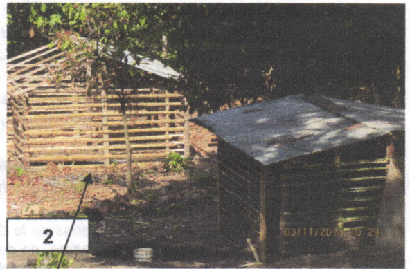
Enjaule de la vivienda en Guadua