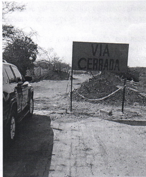
Imagen 6. Fin de la obra, Vía Cerrada.