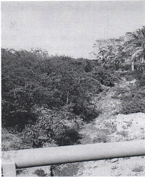
Imagen 5. Cauce Intervenido, Sedimentación Antrópica