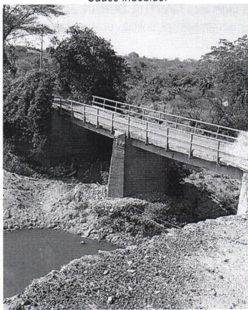
Imagen 4. Taponamiento del cauce intervención del mismo.