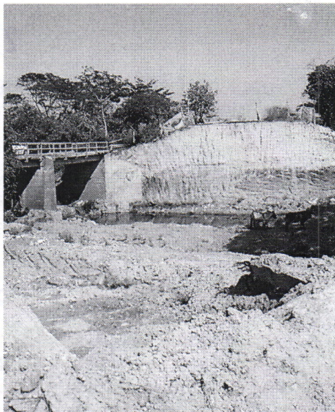
Imagen 2. Estado Actual del lecho de la quebrada, ocupación de Cauce indebido.