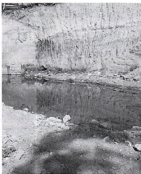
Imagen 3. Afloramiento y estancamiento de agua del Nivel Freático, taponamiento de Cauce