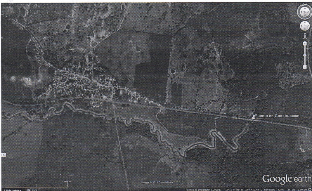
Imagen Satelital 1. Ubicación geográfica del punto de la Obra (Puente en Construcción), Corregimiento de Villa Martin / fuente Google Earth.- coordenadas geográficas Datum (186WGS1984) 11°12'49.33N 72°46'51 O a una altitud de 52 msnm

La construcción de la obra se encuentra ubicada en la vía Nacional que del corregimiento de Villa Martin (Municipio de Riohacha) conduce al corregimiento de Cuestecitas (Municipio de Albania), sobre el sobrepaso del cuerpo de agua denominado Quebrada Moreno.