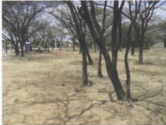
Arboles de Trupillo ( Prosopis juliflora )