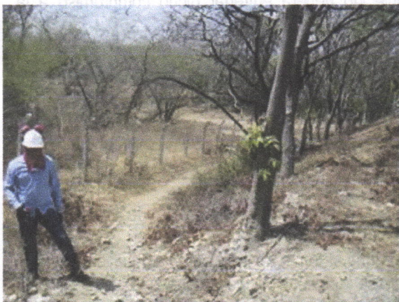
Arbol de Quebracho ( Astronium graveolens )