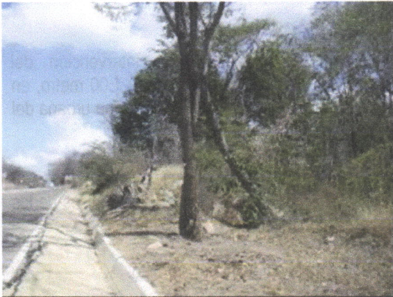
Arbol de Corazonfino ( Platymiscium pinnatum )