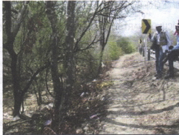
Arbol de Quebracho ( Astronium graveolens )