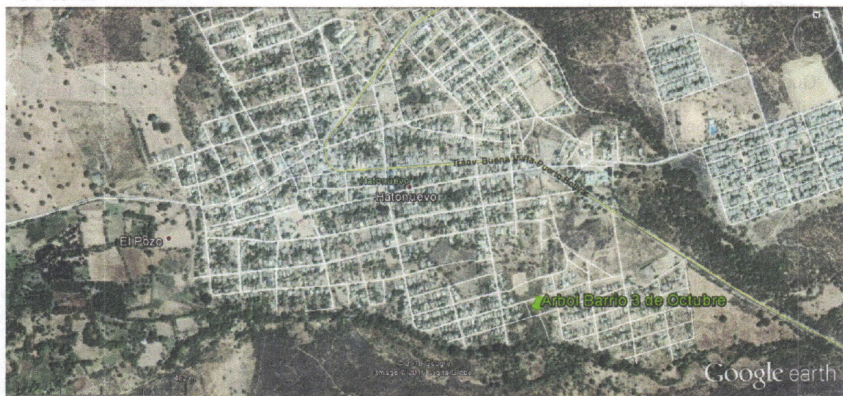
Figura 1: Árbol ubicado en el barrio 3 de Octubre en el Municipio de Hatonuevo – La Guajira.