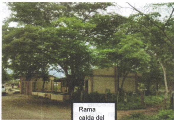
Rama caída del árbol de