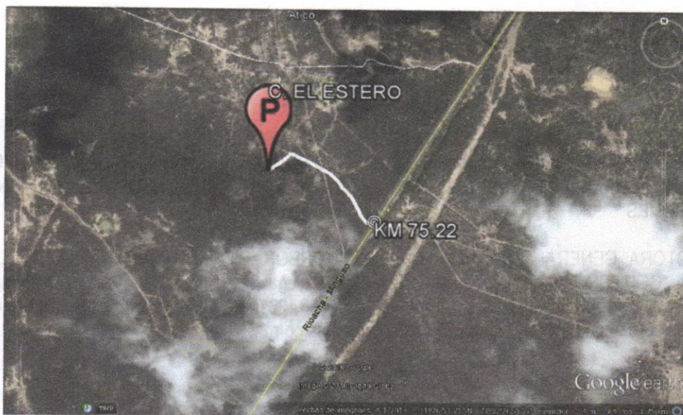
Figura No.1 Localización de la perforación en el Predio