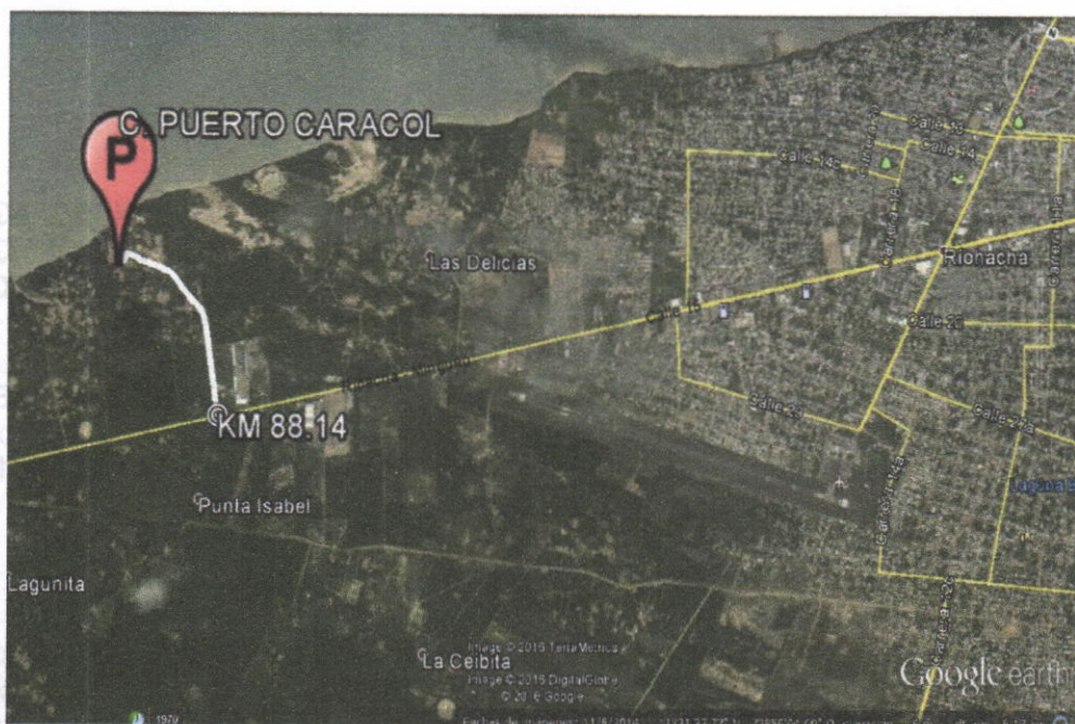
Figura No.1 Localización de la perforación en el Predio