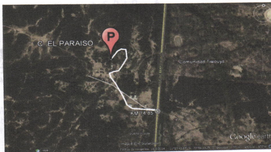
Figura No.1 Localización de la perforación en el Predio