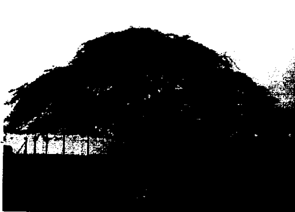
Trupillo ( Prosopis juliflora )

Evidencia de los árboles que requieren permiso de Tala en la subestación eléctrica del Municipio de Maicao.