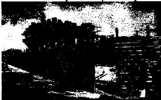
Área externa del sitio