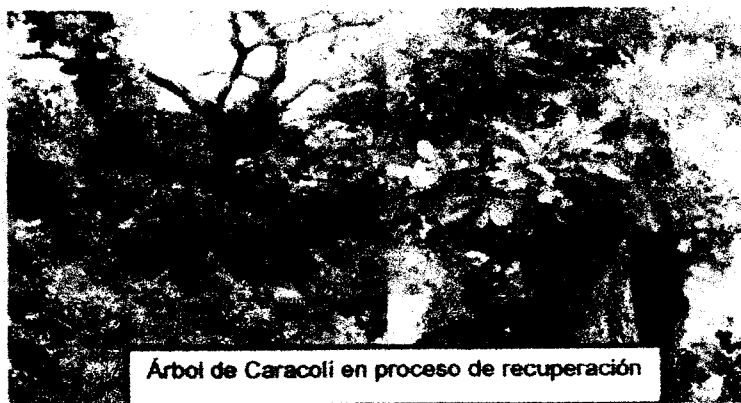
Árbol de Caracolí en proceso de recuperación