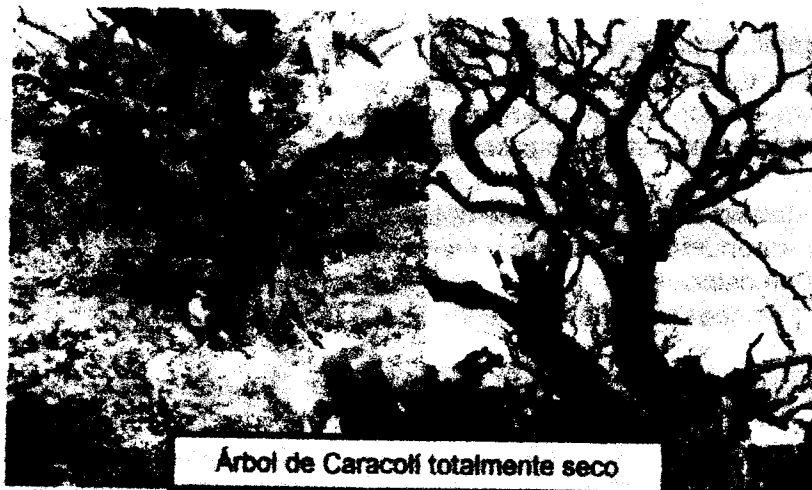
Árbol de Caracolí totalmente seco