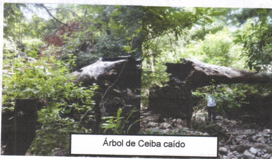
Árbol de Ceiba caído