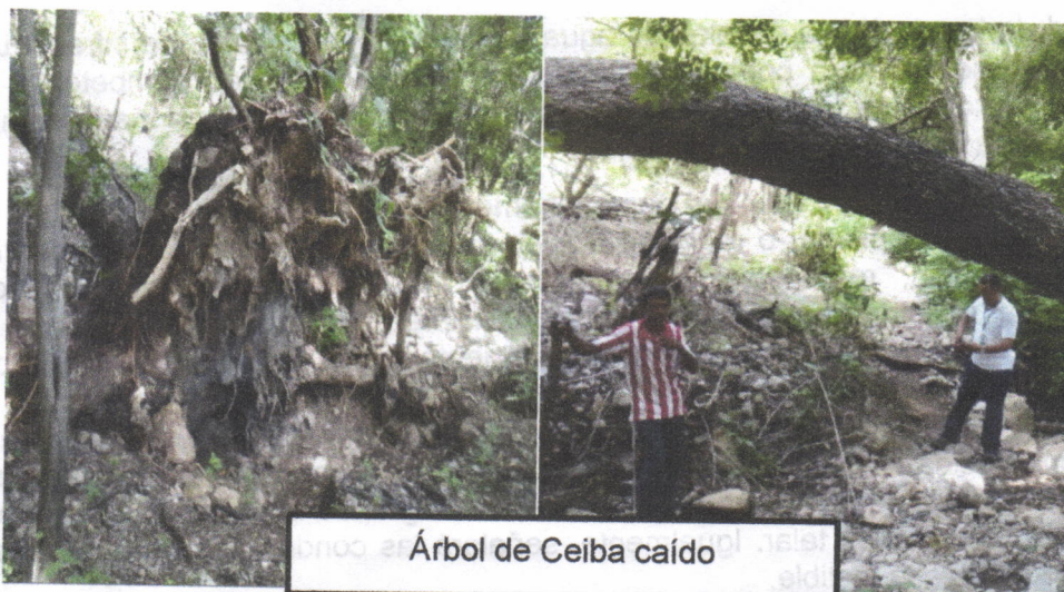
Árbol de Ceiba caído