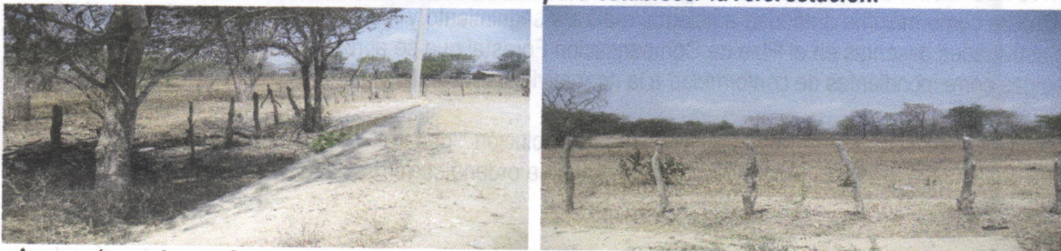
Arroyo el mamón y al fondo el área preparada para iniciar la reforestación ampliada en la foto parte derecha